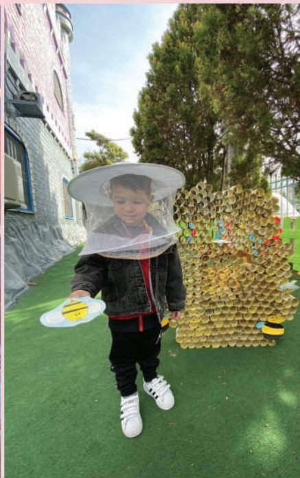
Ο μελισσοκόμος μας !