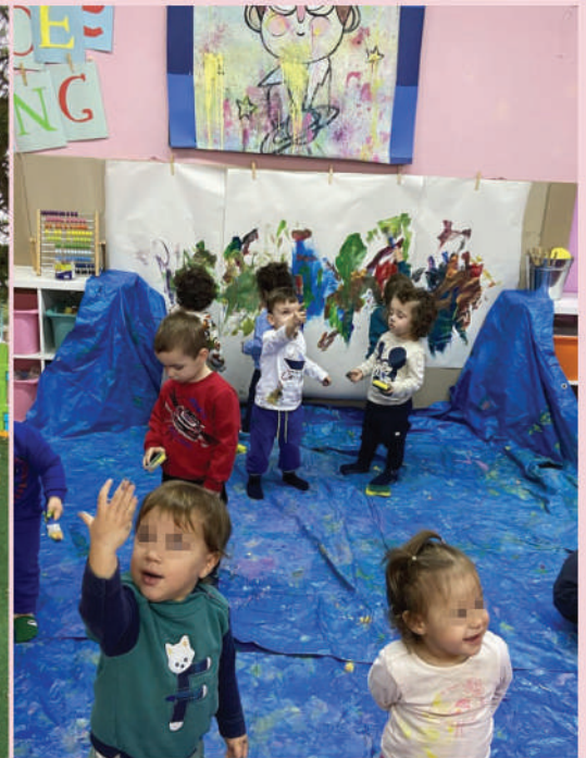
Οι καλλιτέχνες μας !