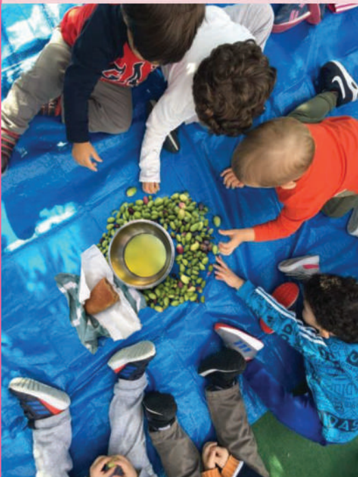
Οι ελαιοπαραγωγοί μας !