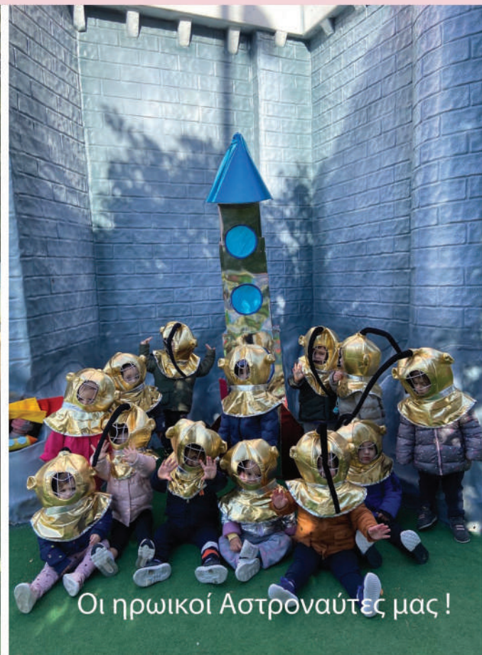
Οι ηρωικοί Αστροναύτες μας!