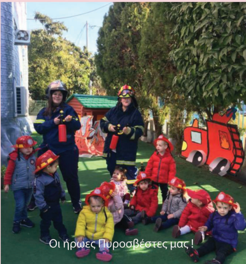
Οι ήρωες Πυροσβέστες μας!