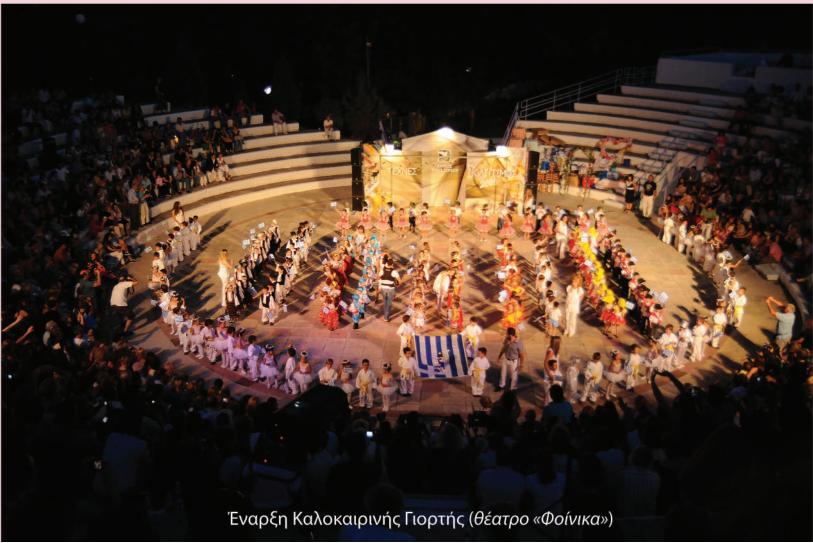
Έναρξη Καλοκαιρινής Γιορτής (θέατρο «Φοίνικα»)

Γιατί οι γονείς εμπιστεύονται το Σχολείο μας :