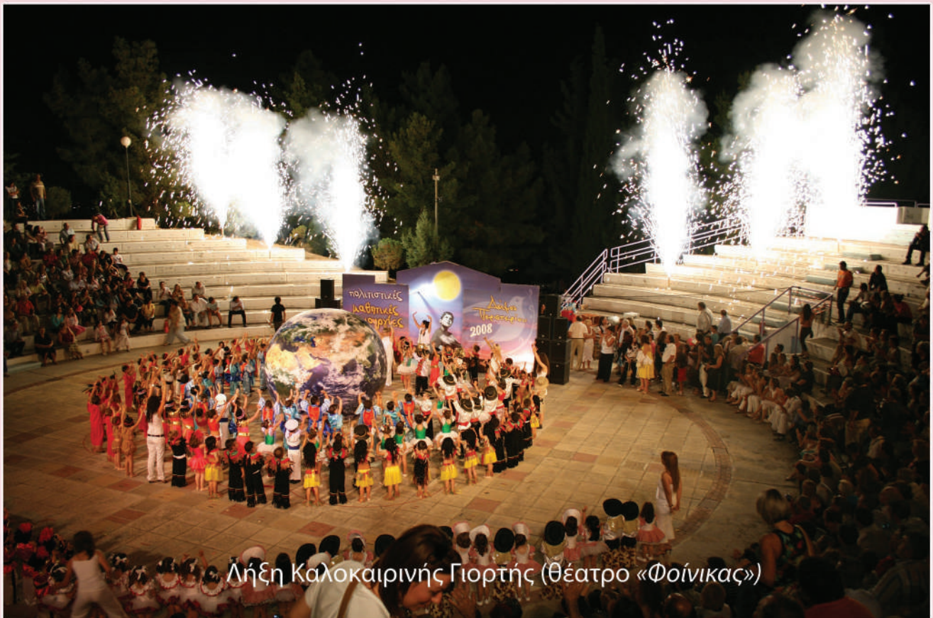
Λήξη Καλοκαιρινής Γιορτής (θέατρο «Φοίνικας»)